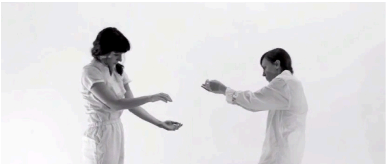
Photo : Singeries , Priscilla Guy et Catherine Lavoie-Marcus / Mandoline Hybride , 2014.

Présenté au Festival international de vidéodanse de Bourgogne (France, 2016)